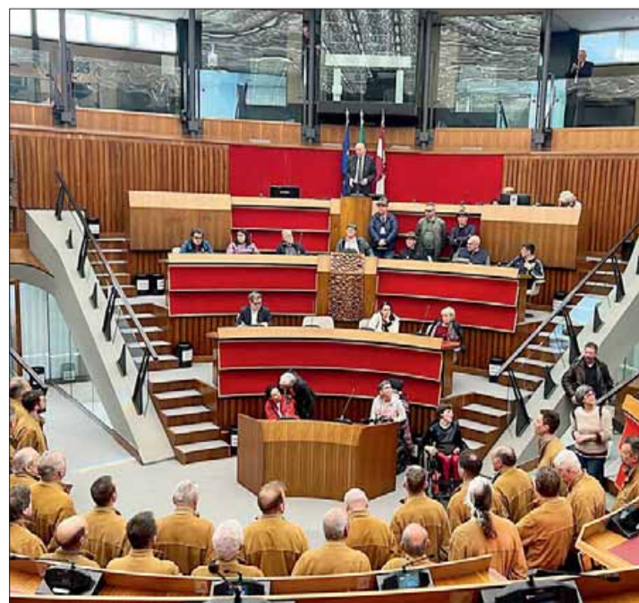
Nella sede del Consiglio regionale sono stati intonati canti popolari e alpini 4Awt.3mjwg3y1-1773042740